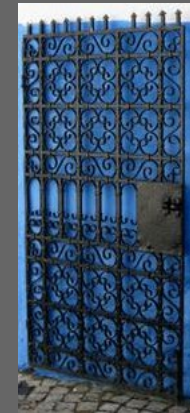
Porte du palais de la kasbah à Rabat Inconnu