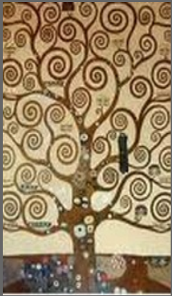
L'arbre de vie, partie centrale Gustave Klimt (1905)