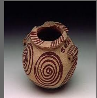
Vase globulaire Egypte (-3500 à -3100 av JC)