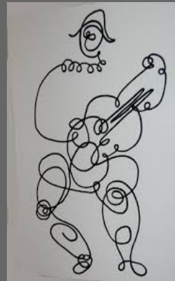
Arlequin Picasso (1918)