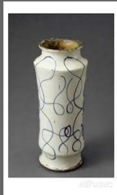
Albarellino, Colombe luttant contre un serpent Inconnu (vers 1500)