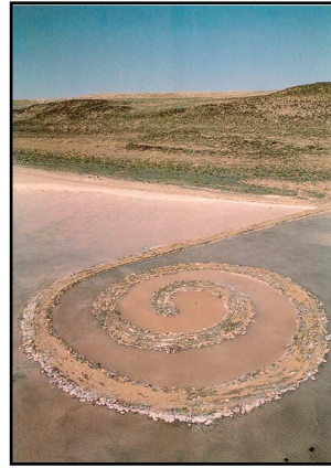
Spirale Jetty de Robert Smithson