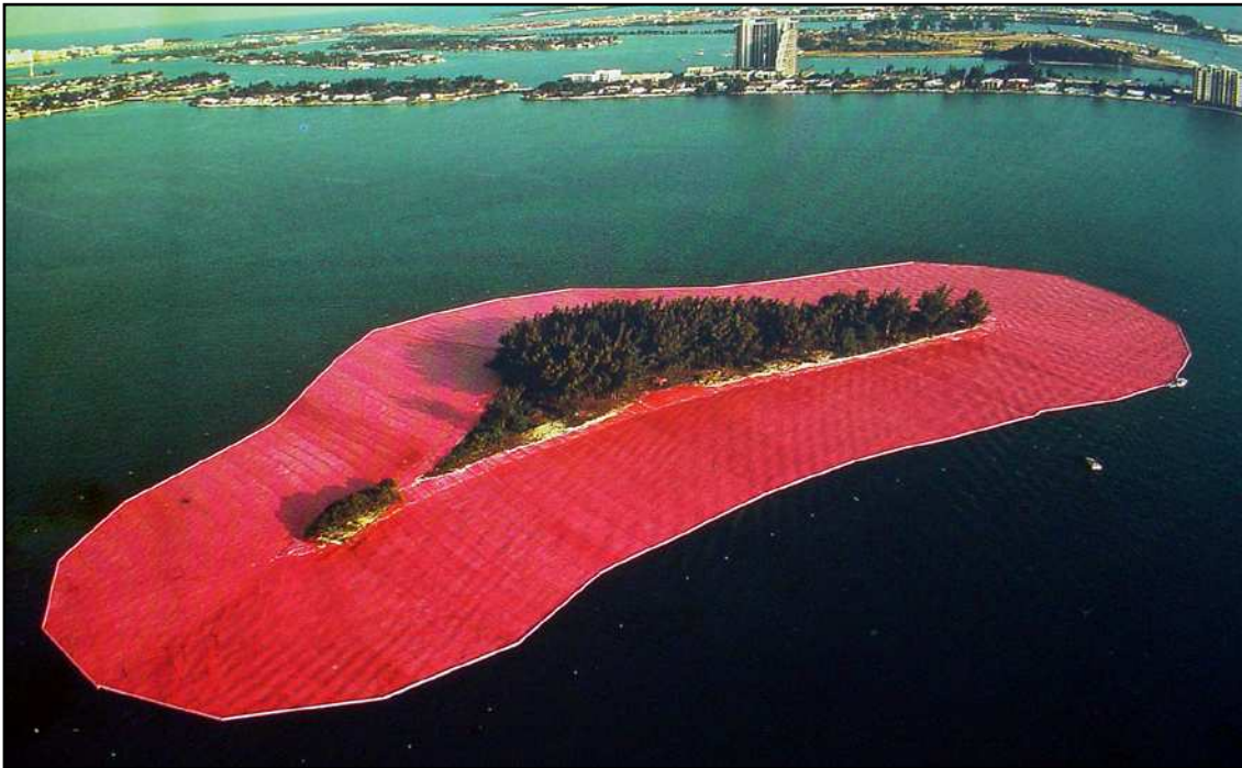
Christo et Jeanne-Claude