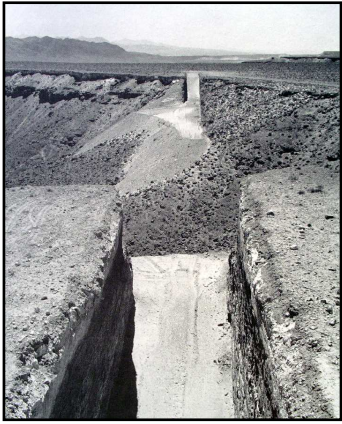
Double Negative de Michael Heizer