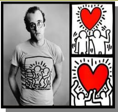
Keith Haring – 1958-1990 Artiste américain (dessinateur, peintre, sculpteur)

A New York, Keith Haring a décidé que ses œuvres n'auraient pas besoin d'entrer dans les musées, où elles ne seraient vues que par quelques personnes. Non, ce qu'il voulait, c'est l'art pour tous !