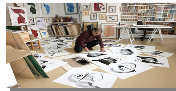
L'artiste dans son atelier parisien

Il expose ses calligraphies régulièrement et a déjà publié une vingtaine de livres.