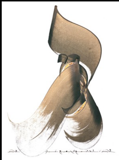
Sur la terre, il y a place pour tous