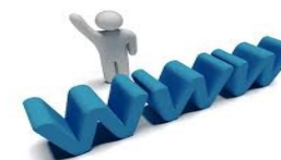
Site et galerie de l'artiste