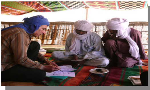
Atelier de calligraphie dans le désert

*Calligraphie : l'art de bien former les caractères d'écriture manuscrite