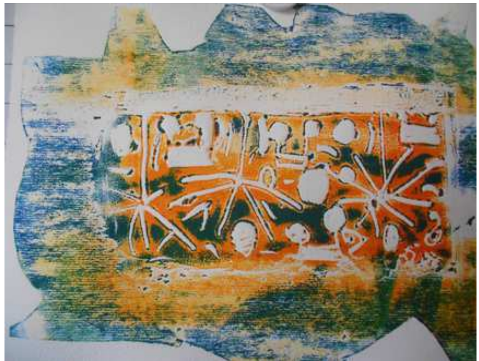
Sylvie Carsenac, conseillère pédagogique départementale en arts visuels